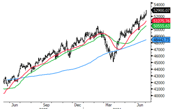
INDU Index (Dow Jones Industrial Average) Monex Analisis Apertura Daily 13MAY2025-03JUL2026 03-Jul-2026 06:25:04