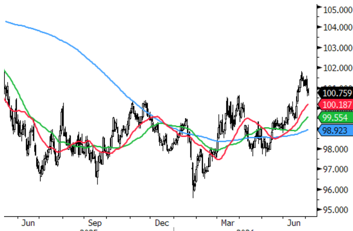
DXY Currency (DOLLAR INDEX SPOT) Monex Analisis Apertura Daily 13MAY2025-03JUL2026 Copyright © 2026 Bloomberg Finance L.P. 03-Jul-2026 06:24:45